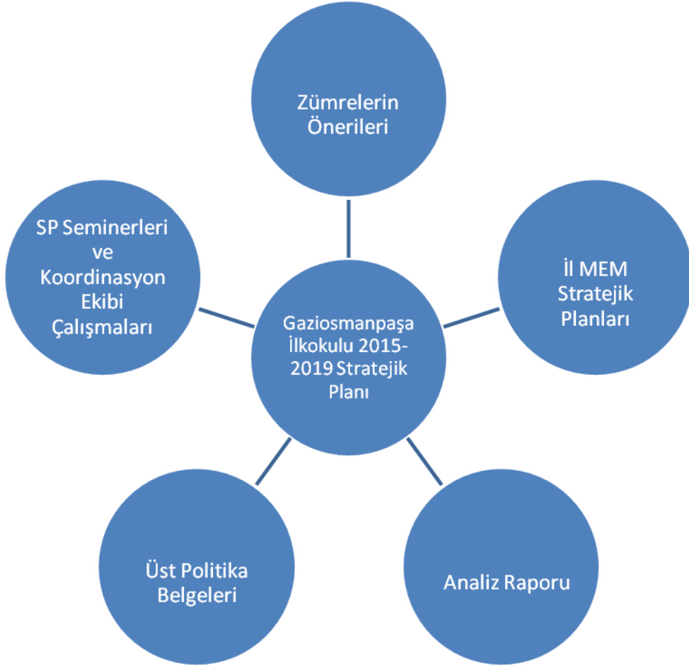
Şekil1:Stratejik Plan Modeli